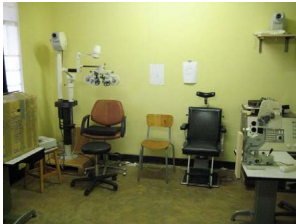
Abb. 2: Die Augenabteilung des Krankenhauses

Dort gibt es eine Augenabteilung mit einer Refraktionseinheit, eine Spaltlampe und eine kleine Werkstatt mit einem Glas- und Fassungsleger.