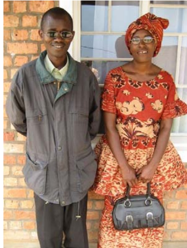
Abb. 3: Patienten mit neuen Brillen

Viele Erfolgserlebnisse werden mir immer in Erinnerung bleiben werden. Wer kann sich nicht das Strahlen in den Augen einer Frau vorstellen, die zum ersten Mal in ihrem Leben eine Brille mit – 8dpt bekommt.