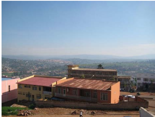
Abb. 1: Blick über Kigali

Nach meinem Abschluss an der Höheren Fachschule für Augenoptik in Köln wollte ich unbedingt für einige Zeit nach Afrika um dort als Augenoptiker zu arbeiten. Auf die Arbeitsstelle bei Optik Delker im „Krankenhaus Ruanda“ bin ich eher durch Zufall aufmerksam geworden. Das Krankenhaus liegt in Ruli, einer kleinen Stadt ca. 40km von der ruandischen Hauptstadt Kigali.