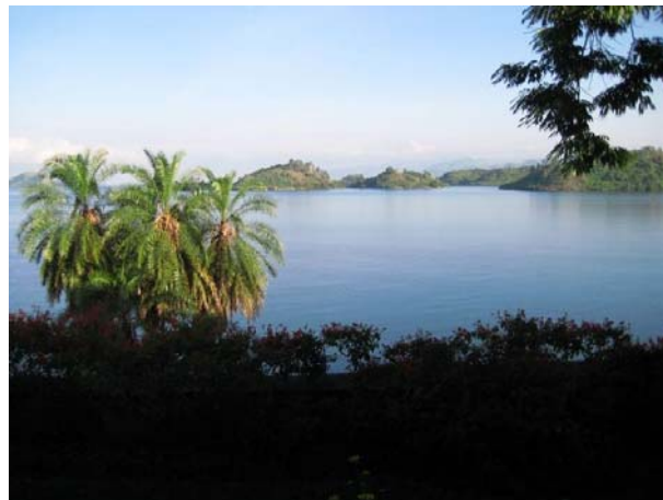
Abb. 4: Lake Kivu