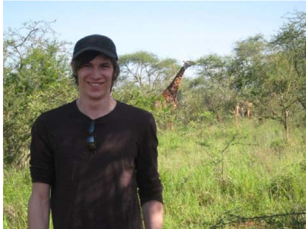
Abb. 7: Der Verfasser

Im Norden sah ich die Vulkanlandschaft, wo ich die letzten Berggorillas der Welt bestaunen konnte.